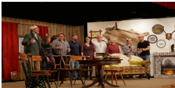
Ein Szenenbild aus „Hüttzauber“ 2023

Das Bild ist eine Szene vom letztjährigen Besuch im Theaterbrette.